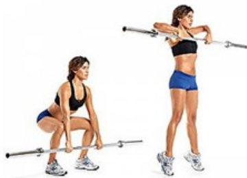
VOGATORE CON MANICO SCOPA