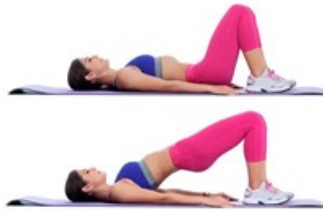
PONTE SUI GLUTEI