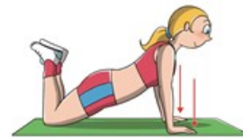
PIEGAMENTI SU GINOCCHIA