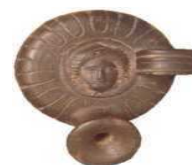
Istituto di "Studi Atellani"