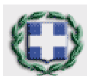
Ambasciata di Grecia