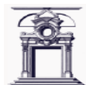
Univ. degli Studi di Napoli "Suor Orsola Benincasa"